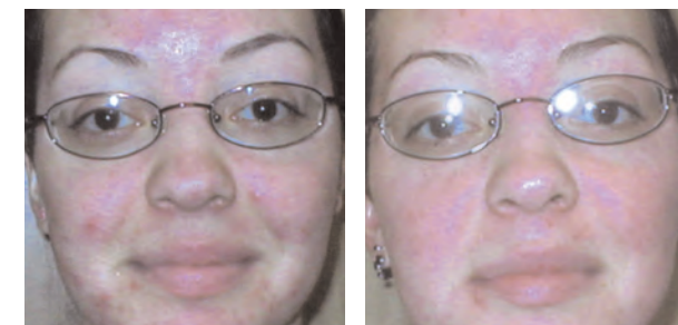
Fotos de antes y después del tratamiento de un paciente con acné